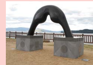
川島 猛 Gate-Muse Love