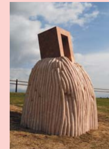
齋藤 徹 Sky and Earth "Circulation 2009"