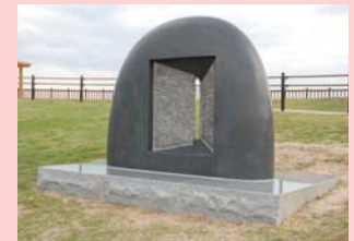
田中 等 The door of the wind