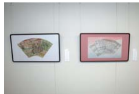
히로세 후미 작품