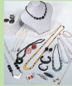
宝石・貴石・半貴石